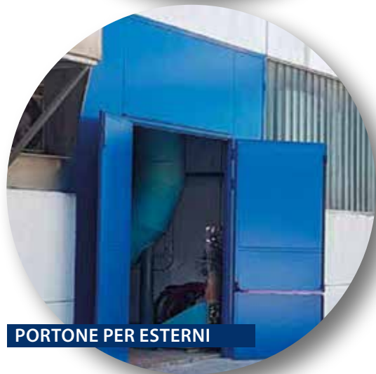
PORTONE PER ESTERNI